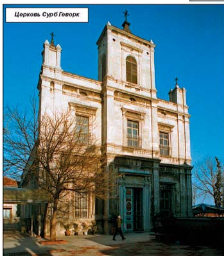
Церковь Сурб Геворг

Стамбула, в том числе, в Ускударе, Кадыкёйе, Балате, Бешикташе, Хизаре и других районах.