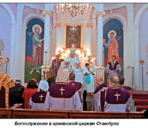
Богослужение в армянской церкви Стамбула

и межрелигиозных контактов, ведь, в основном, армяне этого региона были халкидонитами и попадали под сильное влияние Грузинской Православной Церкви, со временем теряя свою идентичность. Об этом писали многие ученые, констатируя тот факт, что регион Тайк всегда был колыбелью армян-халкидонитов, соответственно большинство христианских церквей и храмов в регионе принадлежит творению армян, в том числе, и знаменитая церковь Ошка, которую грузины называют Ошки и договариваются с турками о реставрации армянской халкидонской церкви, взамен на