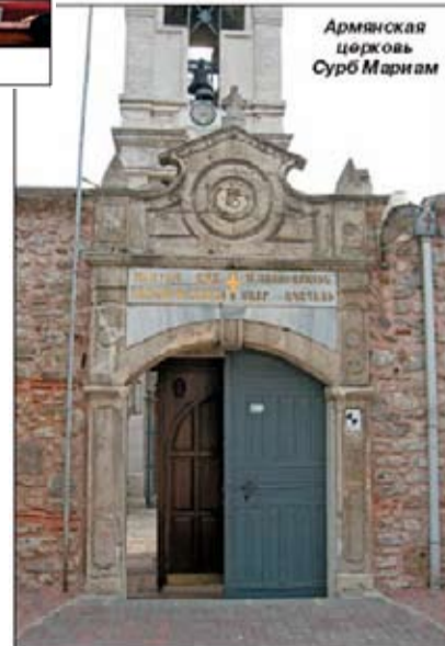
Армянская церковь Сурб Марьям

Армянская Патриархия в Стамбуле – это один из четырех иерархических центров Армянской Церкви (другие три находятся в Ереване, Бейруте и Иерусалиме). Первый стамбульский патриарх Иоахим I занимал высший священный пост во времена правления султана Мехмеда Завоевателя. С 1641 г. года центральная церковь Святой Девы Марии и деревянное здание Патриархии находятся в порту Констанкасион, что ныне район Кумкапы.