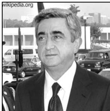
«замороженным конфликтом» - Нагорным Карабахом?

Вопрос: - Какие выводы можно сделать из вторжения в Грузию в связи с другим