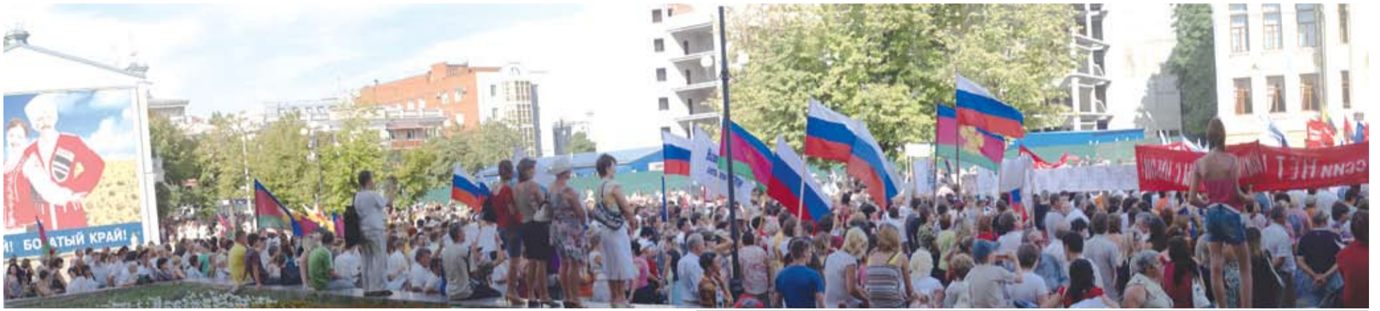
Окончание. Начало на 1-й стр.

«Впервые в мировой истории военная агрессия была развязана в день открытия Олимпийских игр, во время которых традиционно и повсеместно на протяжении мировой истории прекращались войны. Заранее спланированная военная агрессия Грузии привела к многочисленным жертвам среди мирного населения, разрушению городов и сел Южной Осетии. Грузинское Правительство должно знать, что человеческая жизнь бесценна и никакие «благие намерения», никакие политические амбиции и притязания на территорию не могут оправдать гибель людей.